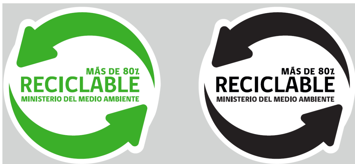
Figura 1: Gráfica del sello de reciclabilidad 2

En la figura 1 se muestran la gráfica del sello de reciclabilidad.